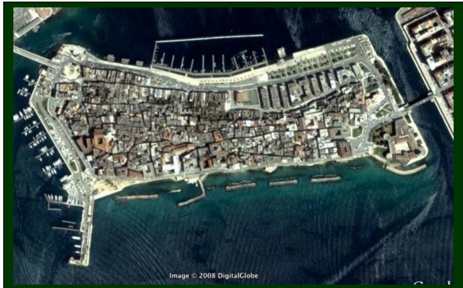
Taranto – l' "isola" tra i due ponti

Jove hath lavished springs evergreen upon and gentle winters ... and Aulon, that beloved hill, ne'er shalt be envying the Falernian grapes ... (e.v.)