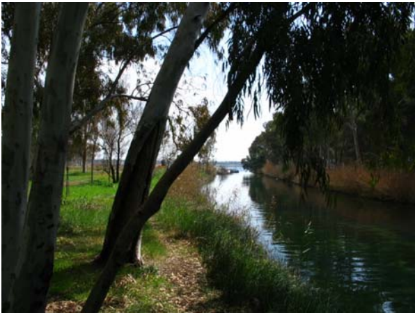
Il fiume Galeso - 29 marzo 2005

Quinto Orazio Flacco, Odi , Libro II, 6, vv.10-12.