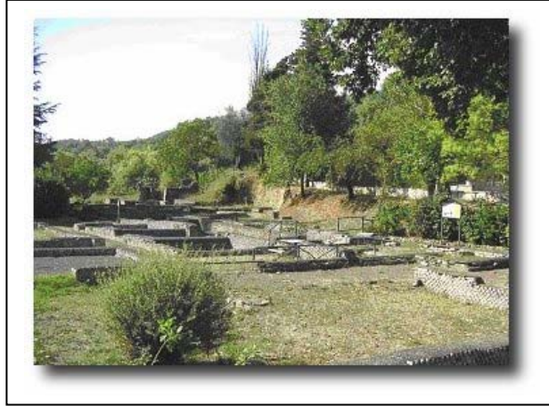
Sabina – resti della villa di Orazio

...I shalt seek the Galeso waters dearest to the hide-wrapped sheep and those fields Phalanthus the Lacedaemonian once ruled over.