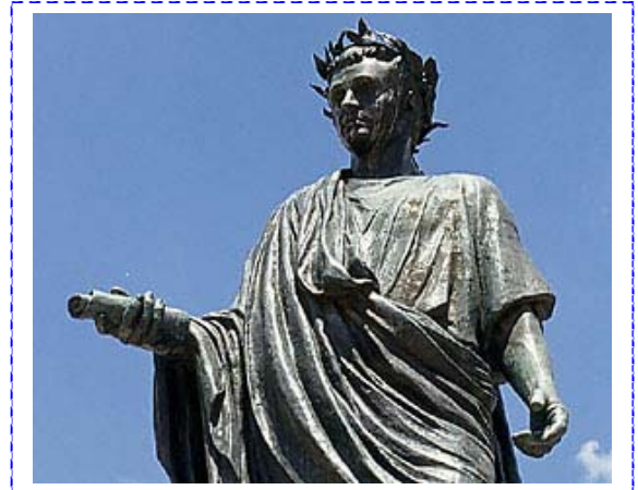
Venosa – Statua di Orazio

Quando Quinto Orazio Flacco (Venosa 65 a.C - Roma 8 a.C.) produsse questi versi doveva essere sulla quarantina e passa. Un'ipotesi avvalorata dal fatto che egli allude a se stesso come “vatis”(poeta vate), parola usata senza falsa modestia perché tale allora era considerato a Roma. Perdi più il tono generale della narratio poetica lascia agevolmente intuire che chi scrive non si considera più giovane. Comunque sia, è indubbio che la composizione risale a circa 20 secoli fa.